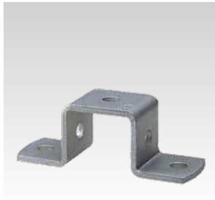
Für Profil 28/30