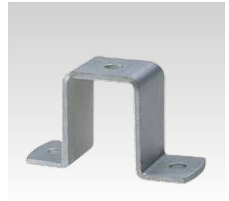
Für Profil 38/40, 38/48, 39/52, 40/60, 40/80, 38/80 und 40/120