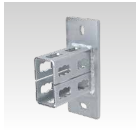
MPR-Sattelflansch Typ S+ für Profil 41/82 und 41/124