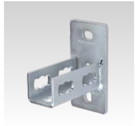
MPR-Sattelflansch Typ S+ für Profil 41/41 und 41/62