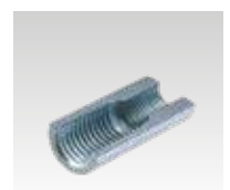
Gewinde ≥ M8/M10