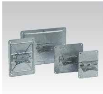
Für Profile 38/24 bis 40/120