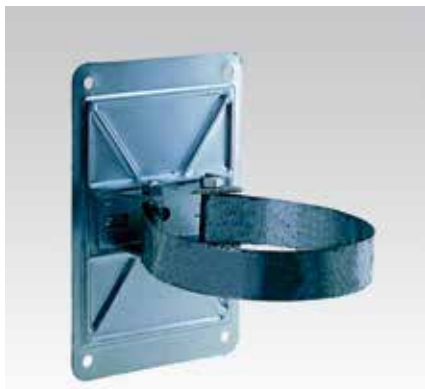
Montage mit ML-Bandschelle