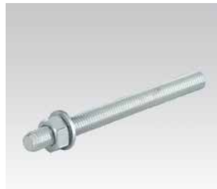
Tige à sceller pour maçonneries pleines et creuses type VMU-A, classe de résistance 5.8