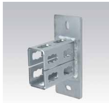
Platine U MPR type S+ pour profil 41/82 et 41/124