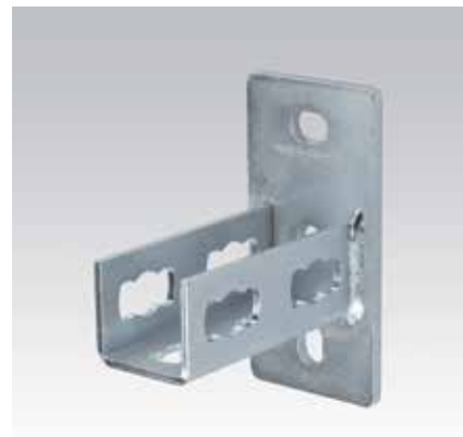
Platine U MPR type S+ pour profil 41/41 et 41/62