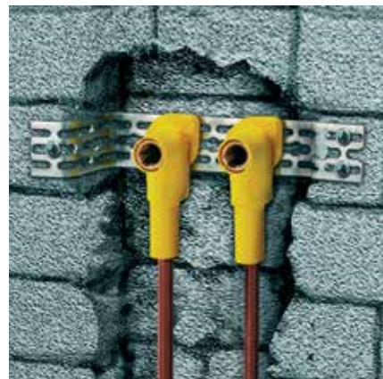
Waschtischinstallation: Installation in engen Mauerausparungen