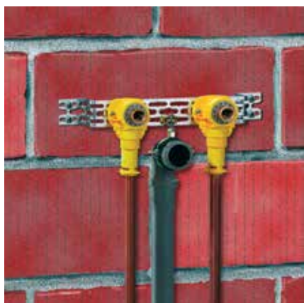
Waschtischinstallation: Alles genau auf Stichmaß montiert