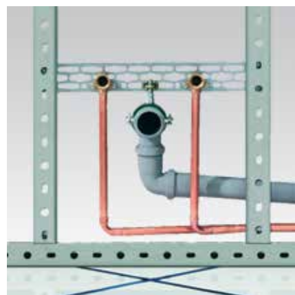
Vorwandinstallation: Vorwandinstallation mit StaboFix® in Verbindung mit MPC-System-schienen